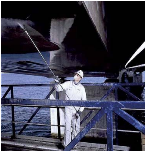
Storebelt Bridge (DK)