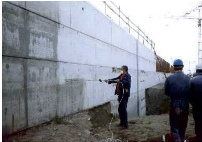
Containerterminal Zeebrugge (B)